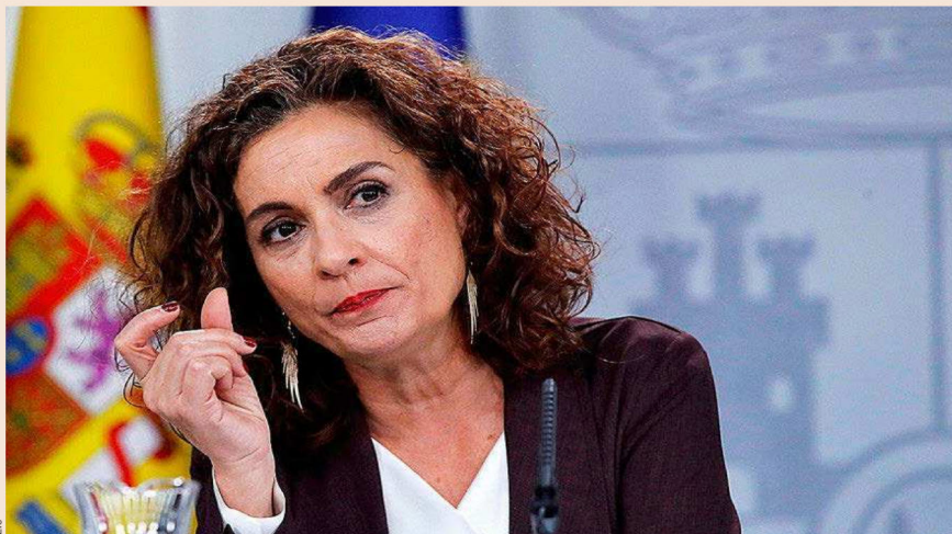
La ministra de Hacienda y portavoz, María Jesús Montero, el martes en la rueda de prensa tras el Consejo de Ministros.

Respecto al debate que azuza Hacienda sobre el tipo efectivo que pagan las empre-